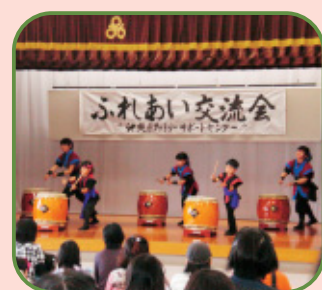
▲沖縄市古謝翔龍太鼓のアトラクション