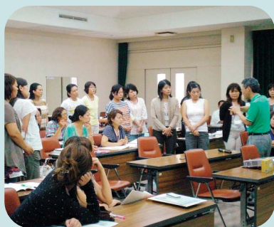
▲小児科の先生から傷口の手当を手ほどき

ご協力頂いた講師の方々、長丁場にも関わらず熱心に受講してくれた会員の皆さん、どうもありがとうございました。これからも相互援助活動へのご協力を宜しくお願い致します！