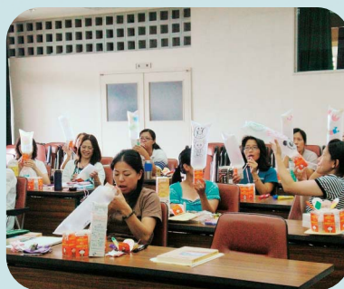
▲身近な物でももちゃが作れたよ！