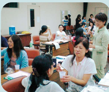
▲食べさせてあげる時は声かけしながら優しくね