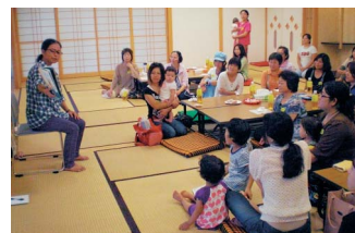
「ともだちシリーズ」の絵本の世界に子ども達もひきこまれています